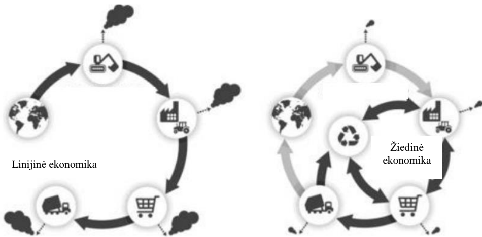
1 pav. Linijinės ir žiedinės ekonomikos koncepcijų skirtumai

išnaudojamas ekonominis jų potencialas. Ilgą laiką vadovaujantis tokiu linijiniu atliekų tvarkymo modeliu, pastebėta, jog jis nėra veiksmingas, todėl šalinant jo trūkumus, susijusius su medžiagų ir produktų vertės praradimu, išteklių trūkumu, sąlygotu kainų nepastovumu, ir klimato pokyčiais, pradėta plėtoti žiedinės ekonomikos koncepcija [1]. Žiedinės ekonomikos koncepcija funkcionuoja cikliniu principu ir yra linijinio modelio tobulesnis variantas, sprendžiantis pagrindines jo problemas – ribotus išteklius, didelę aplinkos taršą, produktų vertės išlaikymą gamybos ir vartojimo procese. Ši koncepcija yra daugiau nei dešimtmetį trukusių pastangų, užtikrinančių tvarų atliekų tvarkymą, rezultatas, kurį pritaikius suteikiama didžiulė pridėtinė vertė aplinkai ir šalies ekonomikai [21]. Tvarus atliekų tvarkymas gali padidinti valstybės bendrąjį vidaus produktą, mažinti priklausomybę nuo importuojamų išteklių, sukurti naujų darbo vietų ir sumažinti šiltnamio dujų emisiją.