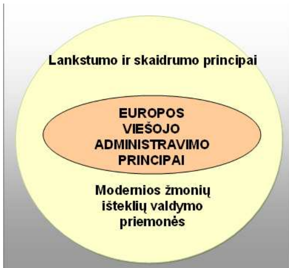
3 pav. Nuosaikus vadybinis valstybės tarnybos reformos modelis

detaaliai reglamentuotas, daugiau lankstumo galimybių numatant esamam valdžios įstaigų personalui valdyti [6, p. 56-57].