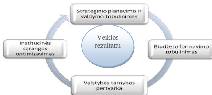
1 pav. Veiklos valdymo tobulinimo kryptys Lietuvoje

programų vertinimo ir funkcijų peržiūros sistemos. Daug dėmesio buvo skiriama įvairių institucijų programų vertinimo ir funkcijų peržiūros gebėjimams didinti.