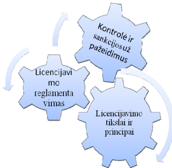
1 pav. Alkoholio licencijavimo politikos įgyvendinimo analitinis modelis

alkoholio pakuotėms, pardavimų pobūdžiu (išsineštinai ar vartoti vietoje) ir pan. Jei tarp pagrindinių tikslų yra visuomenės sveikata ir saugumas, tuomet trumpinamas pardavimų laikas [24], ribojamas pardavimo vietų tankis, t. y. licencijų išdavimas tam tikroje teritorijoje, atsižvelgiant į gyventojų skaičių ar geografinį vienetą [9,4]. Pavyzdžiui, Škotijoje licencijose reglamentuojama alkoholių pardavimų tipas ir kiekis, pardavimo valandos ir pardavimo sąlygos. Licencijavimo vaidmuo yra valdyti pardavimus, kad būtų mažesnė alkoholio vartojimo keliamo žala. Nuo 2010 m. alkoholio pardavimo sąlygos dar labiau sugriežtintos, nes draudžiama daryti finansines nuolaidas alkoholiniams gėrimams, ribojamas pardavimų skatinimas, prekybininkai įpareigoti plėtoti atsakingą prekybą alkoholiu. Neužtikrinus minėtų priemonių, atsiranda teisinė atsakomybė su įvairiomis sankcijomis [20].