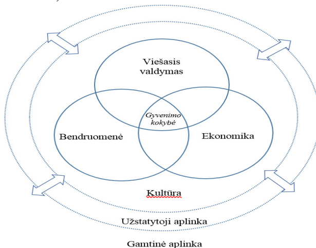
1 pav. Regiono sistemos posistemės